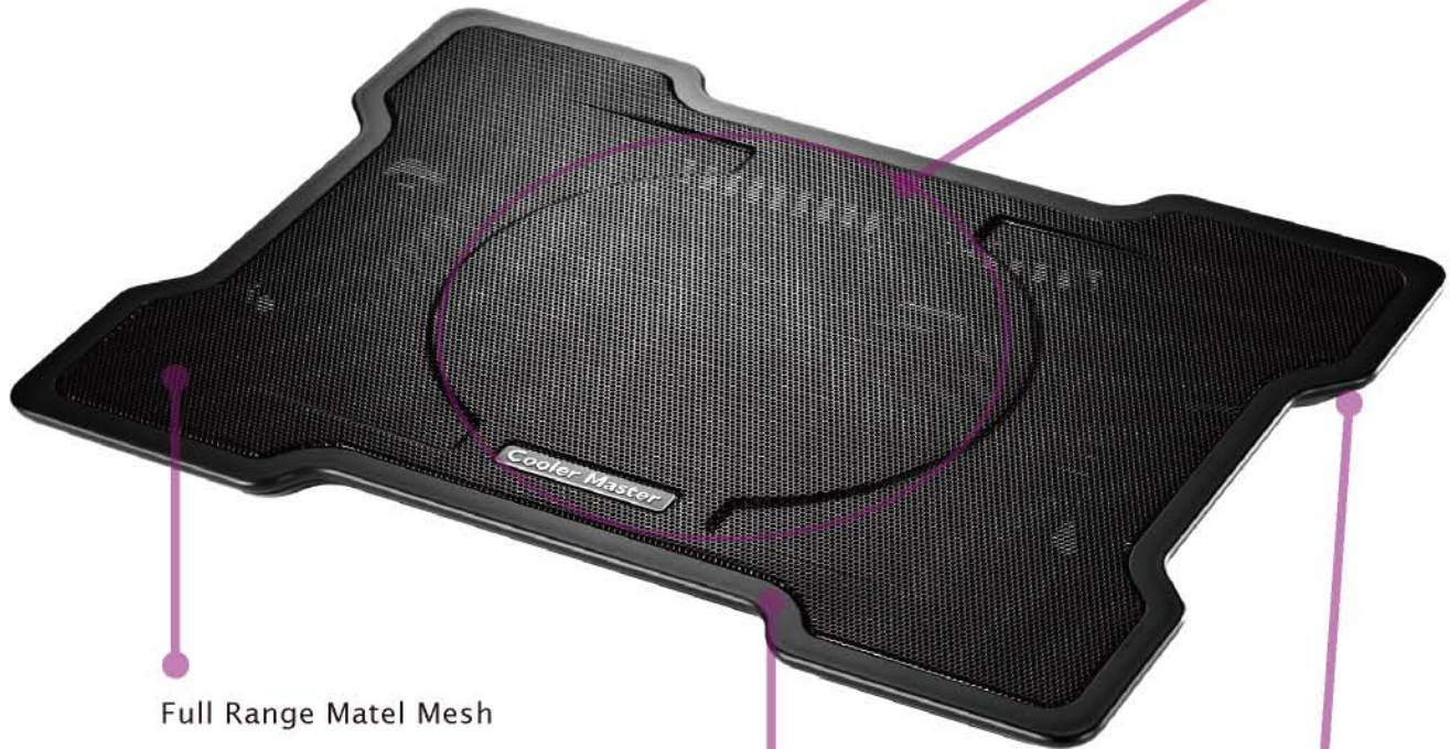
Full Range Metal Mesh