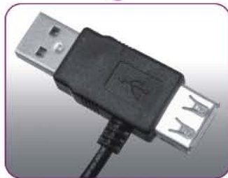
USB Extender Returns Your Laptop's USB Port