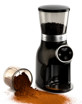
Burr Coffee Grinder AD 4450