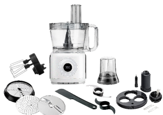
FOOD PROCESSOR AD 4224