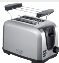
TOASTER 2 SLICE AD 3222