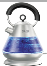
Electric Kettle AD 1282