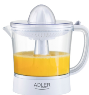
CITRUS JUICER AD 4009