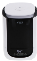
AIR HUMIDIFIER AD 7966