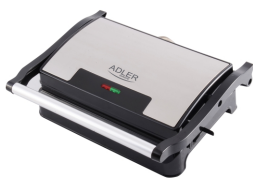
ELECTRIC GRILL AD 3052