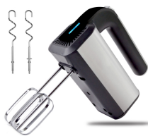
MIXER AD 4225