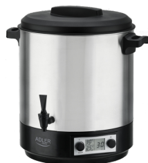
PASTEURIZATION POT AD 4496