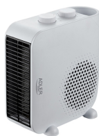
FAN HEATER AD 7725