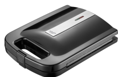
Sandwich Maker AD 3055