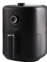
AIR FRYER AD 6310