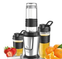
PERSONAL BLENDER AD 4081