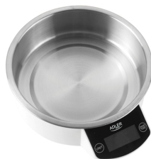
KITCHEN SCALE AD 3166