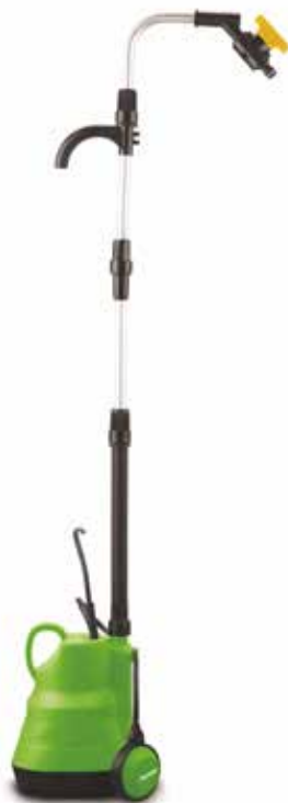
FVC 3002 ED