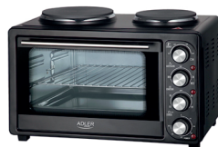
Electric Oven With HOB AD 6020