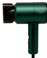
HAIR DRYER AD 2265