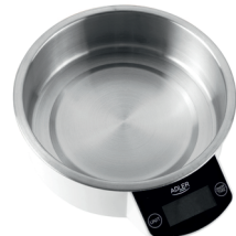
KITCHEN SCALE AD 3166