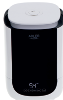
AIR HUMIDIFIER AD 7966