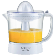
CITRUS JUICER AD 4009