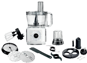
FOOD PROCESSOR AD 4224