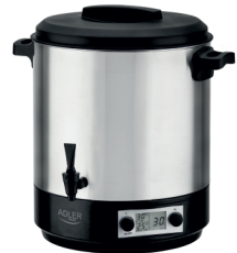
PASTEURIZATION POT AD 4496