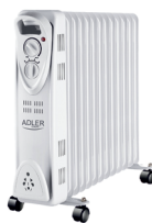
OIL-FILLER RADIATOR AD 7811