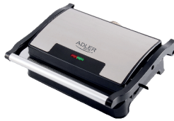
ELECTRIC GRILL AD 3052