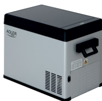
PORTABLE FRIDGE AD 8077