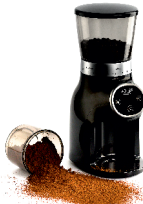
Burr Coffee Grinder AD 4450