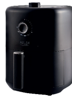
AIR FRYER AD 6310