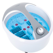
FOOT SPA AD 2177