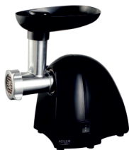
MEAT MINCER AD 4811