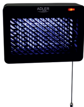
MOSQUITO LAMP AD 7938