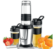
PERSONAL BLENDER AD 4081