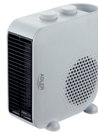
FAN HEATER AD 7725