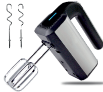
MIXER AD 4225