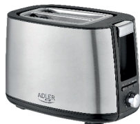
TOASTER 2 SLICE AD 3214