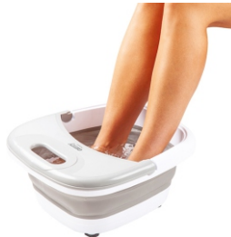
FOOT SPA CR 2174