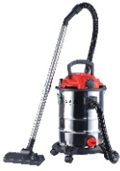
VACUUM CLEANER CR 7045