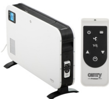
CONVECTION HEATER CR 7724