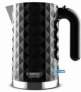
Electric Kettle CR 1169