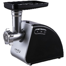
MEAT MINCER CR 4812