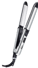
HAIR STRAIGHTENER CR 2320