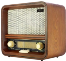
RETRO RADIO CR 1188