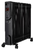
OIL FILLED RADIATOR CR 7814