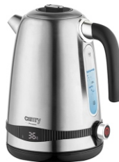
ELECTRIC KETTLE CR 1291