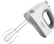
MIXER CR 4220