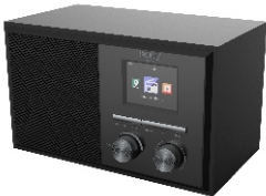
INTERNET RADIO CR 1180