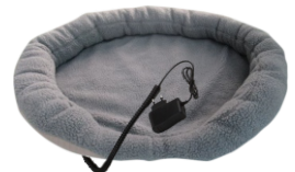
HEATED ANIMAL DEN CR 7431