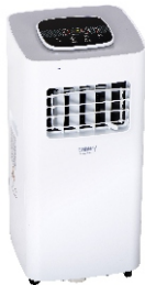
AIR CONDITIONER CR 7926