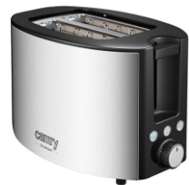
TOASTER 2 SLICES CR 3215