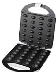
Nut Cookie Maker AD 3039