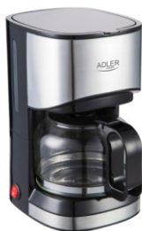
Dripp Coffee Maker AD 4407