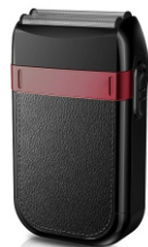
Hair Shaver AD 2932