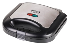
Sandwich maker AD 3015