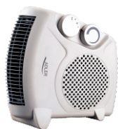
Diet Kitech Scale AD 3133