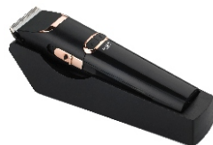
Hair Clipper AD 2832