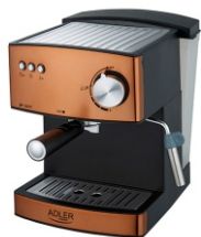
Espresso Machine AD 4404