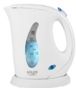
Electric Kettle AD 02