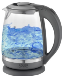
Kettle AD 1286