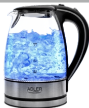
Electric Kettle AD 1225