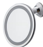
Led Bathroom Mirror AD 2168