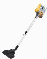
Bagless Vacuum AD 7036