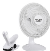
Desk fan 15 cm with clip AD 7317