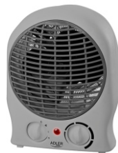
Fan Heater AD 7717