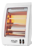
Quartz Heater AD 7709