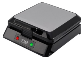
Waffle Maker AD 3036