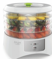
Food dryer AD 6654