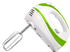
Mixer AD 4205