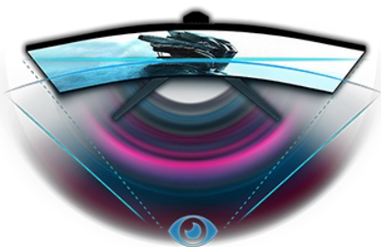
ZAKRIVLJENI DIZAJN 1500R

Postolje podesivo po visini obezbeđuje Vam lako prilagožavanje položaja ekrana i lako prilagodljive postavke ekrana koristeći unapred definisane i prilagođene režime igara, a zajedno sa funkcijom Black Tuner, omogućava Vam kontrolu nad mračnim scenama kako biste bili sigurni da su detalji uvek jasno vidljivi.