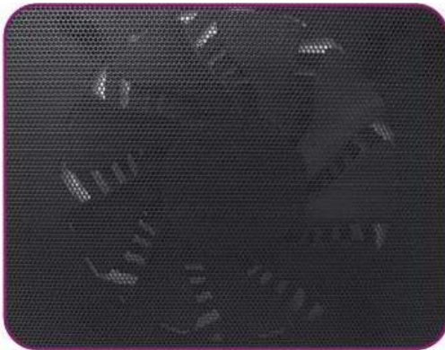
Silent 160mm Fan