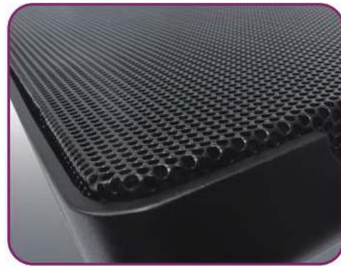
Full Range Mesh