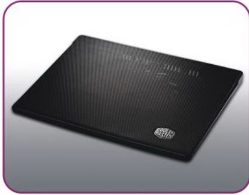
Slim and Lightweight