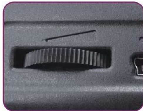
Fan Speed Dial

Note: Photos may differ slightly from the final product