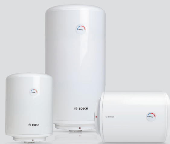
Tronic 1000 T/2000 T od 30 do 150 lit.