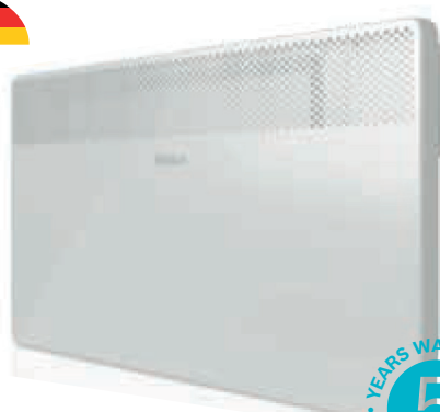
HC4000 Električni radijator - konvektori