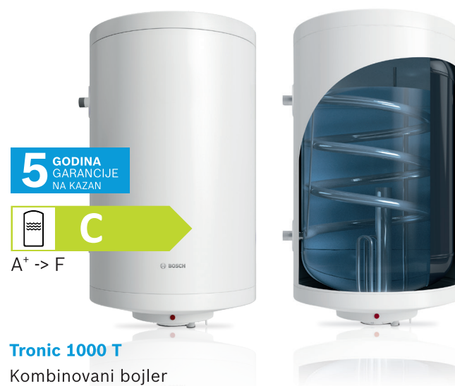
Tronic 1000 T Kombinovani bojler

Ovi bojleri tople vode omogućavaju uštedu energije u sezoni grejanja tokom godine. To je omogućeno ugrađenim izmenjivačem toplote (spiralnom cevi). Pomoću njega se voda u bojleru zagreva bez potrošnje električne energije, preko centralnog sistema grejanja.