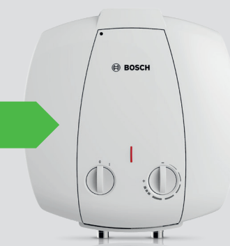
Tronic 2000 T mini