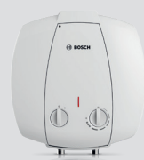
Tronic 2000 T mini 10 lit.