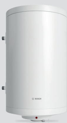
Tronic 1000 T sa izmenjivačem toplote 80 i 100 lit.