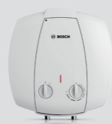
Tronic 2000 T mini 10 lit.