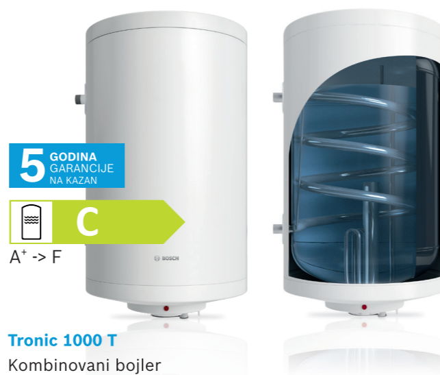
Tronic 1000 T Kombinovani bojler

Ovi bojleri tople vode omogućavaju uštedu energije u sezoni grejanja tokom godine. To je omogućeno ugrađenim izmenjivačem toplote (spiralnom cevi). Pomoću njega se voda u bojleru zagreva bez potrošnje električne energije, preko centralnog sistema grejanja.