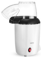
Popcorn maker CR 4458