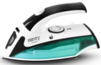
Travel Iron CR 5024