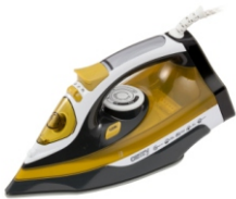
Steam Iron CR 5029