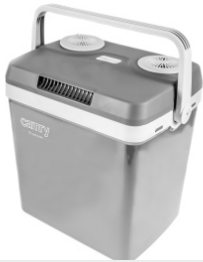
Portable Cooler CR 93