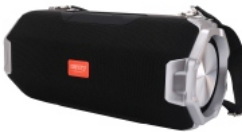
Bluetooth Speaker CR 1170