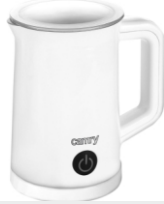
Milk Frother CR 4464