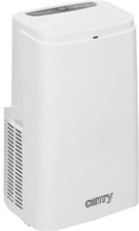
Air conditioner CR 7907