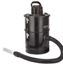
Ash Vacuum 25L 1200W CR 7030