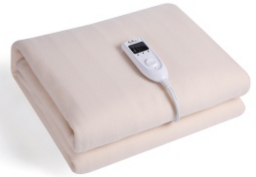
Electric Blanket CR 7407