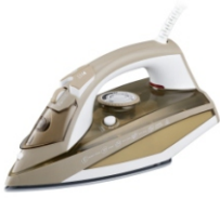
Steam iron CR 5018