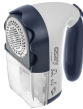
Lint remover CR 9606