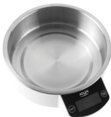
Kitchen Scale AD 8121