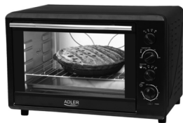
ELECTRIC OVEN AD 6010