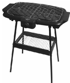
ELECTRIC GRILL AD 6602