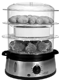
STEAM COOKER AD 634