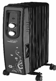
OIL HEATER AD 7801