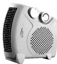
FAN HEATER AD 77