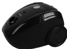
CYCLONE VACUUM CLEANER AD 7007