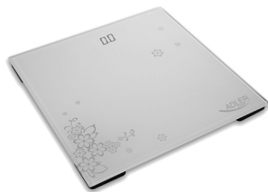
BATHROOM SCALE AD 8130