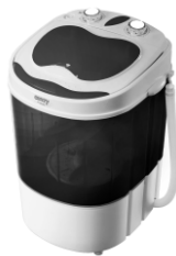
WASHING MACHINE CR 8054