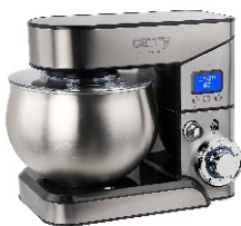
FOOD PROCESSOR CR 4223