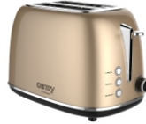
TOASTER 2 SLICES CR 3217