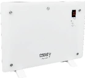
GLASS HEATER CR 7721