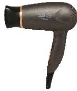
HAIR DRYER CR 2261