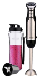
PERSONAL BLENDER CR 4615