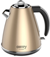
ELECTRIC KETTLE CR 1292