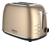
TOASTER 2 SLICES CR 3217