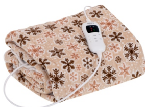
HEATING UNDERBLANKET CR 7430