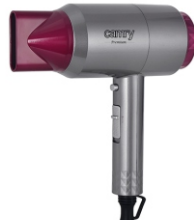
HAIR DRYER CR 2256