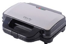
SANDWICH MAKER CR 3054