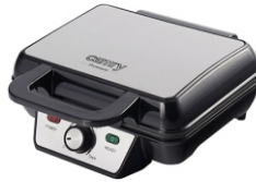
WAFFLE MAKER CR 3046