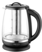
ELECTRIC KETTLE CR 1290