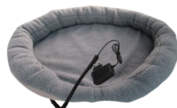
HEATED ANIMAL DEN CR 7431