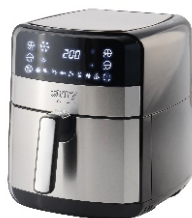
AIR FRYER OVEN CR 6311