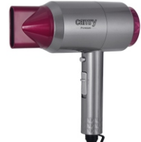
HAIR DRYER CR 2256