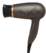
HAIR DRYER CR 2261