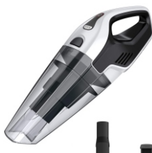
BAGLESS VACUUM CLEANER CR 7046