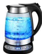
ELECTRIC GRILL CR 3044