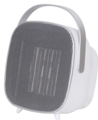
CERAMIC FAN HEATER CR 7732