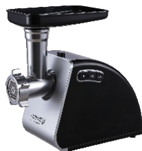
MEAT MINCER CR 4812