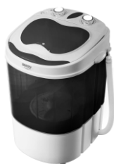
WASHING MACHINE CR 8054