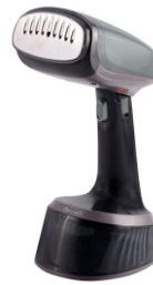
GARMENT STEAMER CR 5033