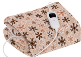
HEATING UNDERBLANKET CR 7430