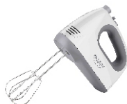
MIXER CR 4220