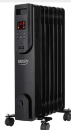
OIL FILLED RADIATOR CR 7812