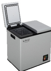
PORTABLE FRIDGE CR 8076