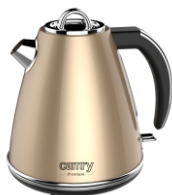
ELECTRIC KETTLE CR 1292