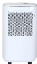
AIR DEHUMIDIFIER CR 7851