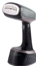
GARMENT STEAMER CR 5033