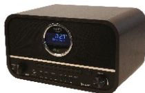
RETRO RADIO CR 1182