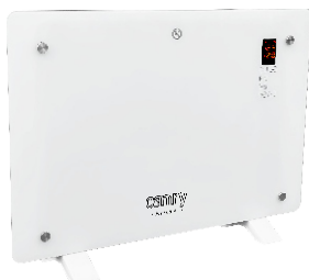
GLASS HEATER CR 7721