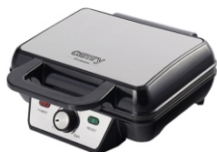
WAFFLE MAKER CR 3046