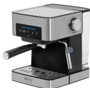
ESPRESSO MACHINE CR 4410