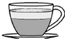
cappuccino (espresso zalane spienionym mliekiem, posypane cokoladú)