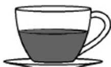
americano, coffee lungo (espresso z podvojnou ilošciú vody)