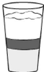
latte macchiato (tri vyrazne warstvy: gorace mlieko, espresso i mliecna piana)