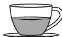
coffee au lait (kawa z mliekmi)