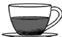
kawa po turecku