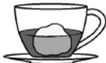
affogato (espresso z kulkou lodov vaniliovych)