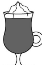
irish coffee (kawa z whiskey i bitou šmietanou)