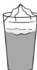
frappe (kawa rozpustcizalna zmiksowana z mliekiem i z cukrom)