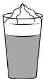
mocha (espresso z mliekiem i cokoladou ozdobione bitou šmietanou)