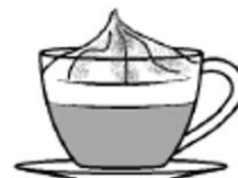
kawa po wiedeńsku (mocna kawa z bitou šmietanou, posypana kakaeom)