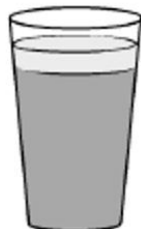
coffee latte (mocna kawa zalana duzu ilosciou goraceho mlieka)